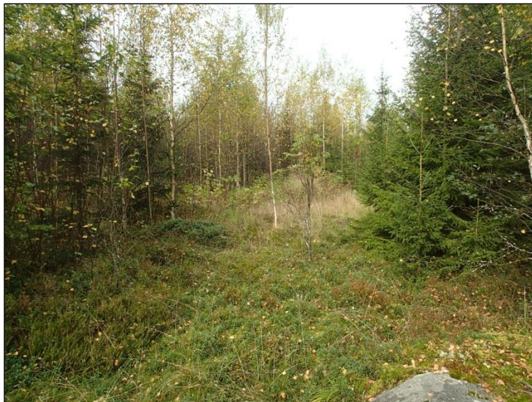
Voimalapaikan 4 maastoa taustalla pusikossa.