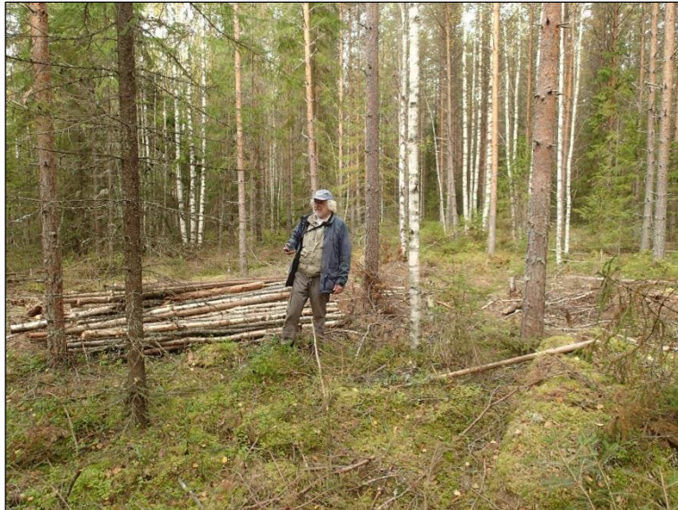
Voimalapaikan 1 maastoa, pohjoiseen.