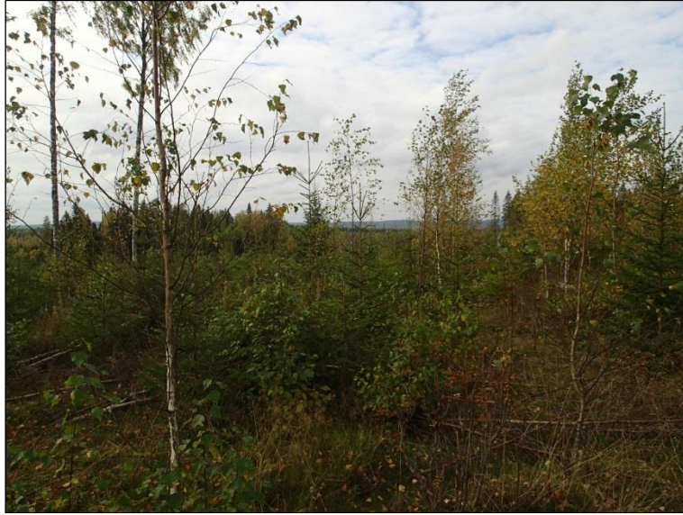
Voimalapaikan 3 maastoa